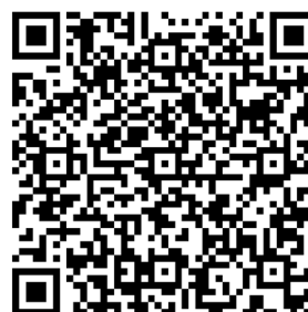
QR Code Anmeldung für die Ferienangebote OGS

https://edkimo.com/shared/sxukbut wwff02x6axoxispx0ra40j7ytr30